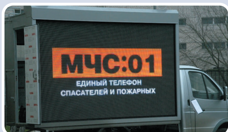
Мобильный комплекс информирования и оповещения населения