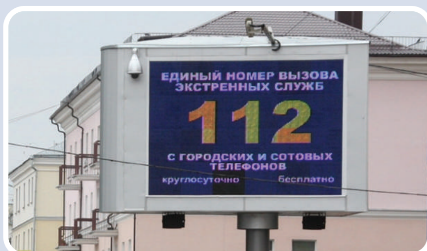
Пункт уличного информирования и оповещения населения