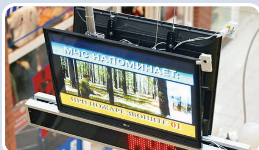
Пункт информирования и оповещения населения в зданиях с массовым пребыванием людей